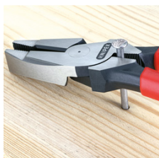
Область захвата под шарниром для мощного рычажного усилия