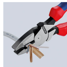
Продольное резание для разделения плоских кабелей